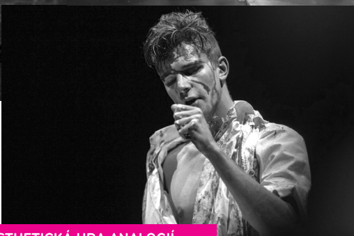
SYNESTHETICKÁ HRA ANALOGIÍ