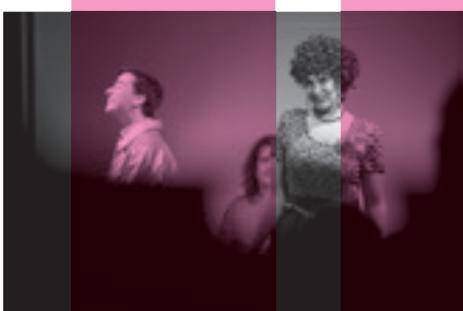
↳ Vaňku, člověče