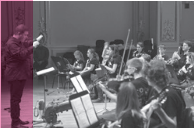
↳ Vesmírná odyssea