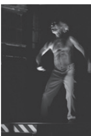
↳ Železná cesta